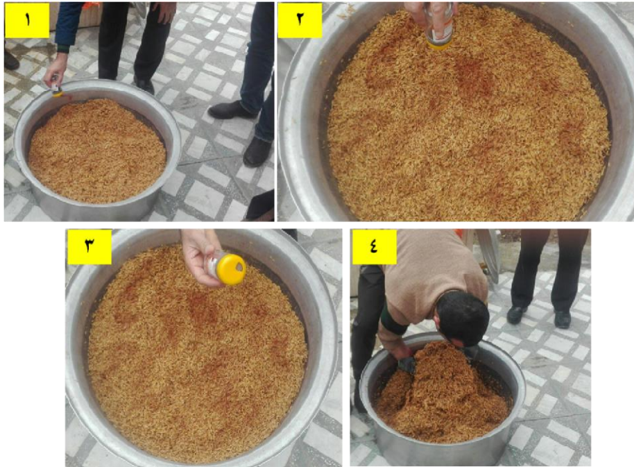
شکل ۳- بذرمالی با قارچکش نوردوکس: مراحل ۱، ۲ و ۳- پاشیدن قارچکش نوردوکس روی بذر خیس توسط نمک پاش. مرحله ۴- بهم زدن و مخلوط کردن نوردوکس با بذور