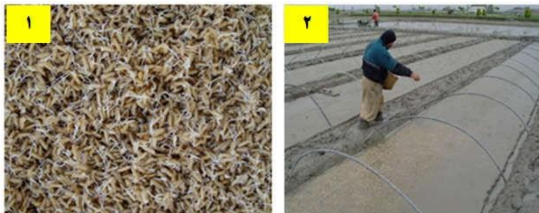
شکل ۴- مرحله ۱) بذر جوانه زده و آماده برای بذرپاشی، مرحله ۲) بذر پاشی در خزانه جوی پشته

بذور ضدعفونی و جوانه دار شده طی مراحل فوق، با تراکم مناسب در خزانه ایی که از قبل آماده شده، پاشیده شوند (شکل ۴ مراحل ۱ و ۲).