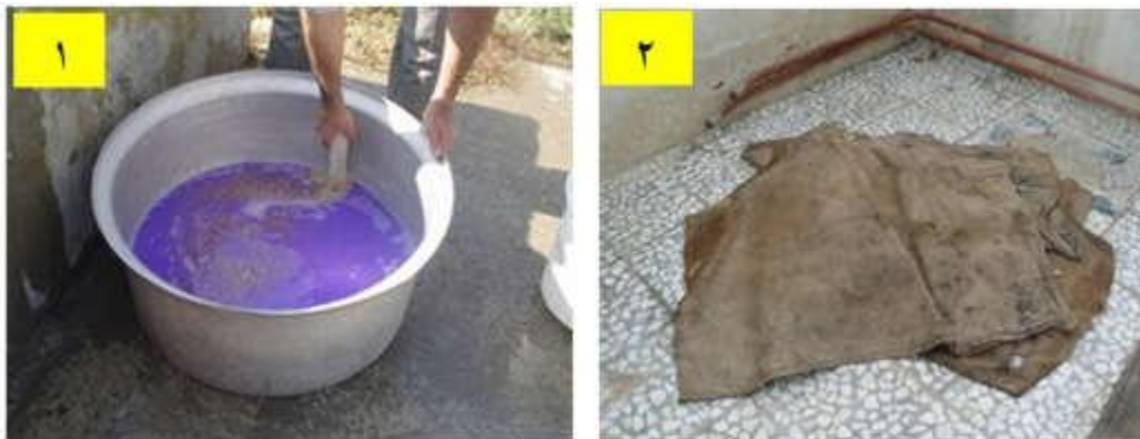
شکل ۲- مراحل ضد عفونی بذر و کاشت در خزانه

مرحله ۱- خیساندن بذر در محلول قارچکش، مرحله ۲- نگهداری بذر ضد عفونی شده در گرمخانه برای جوانه زنی